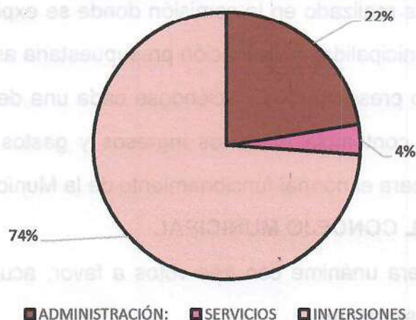
TOTALES POR OBJETO DEL GASTO