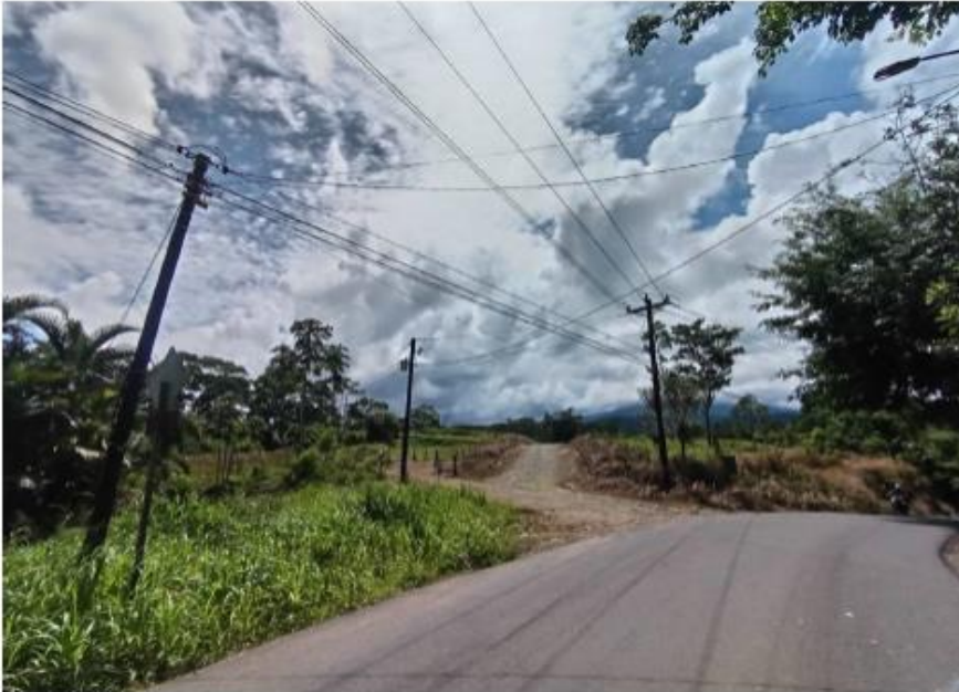
Vista sección Puente sobre Río Culebra